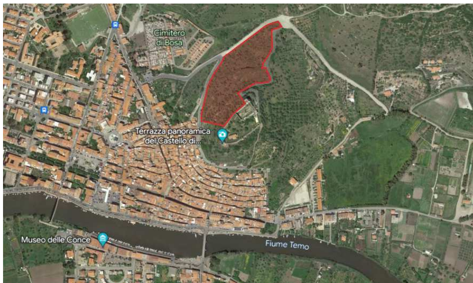
Ortofoto uliveto

Che l'Unione Planargia intende raccogliere manifestazioni di interesse per l'affidamento, tramite convenzione, a titolo gratuito, a privati, della manutenzione e della gestione dell'uliveto ubicato nel comune di Bosa in zona Castello e distinto al NCT al foglio 37 particella 793, come sotto raffigurato.